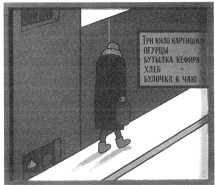
Viktors Pivovarovs. No cikla "Dzīvoklis nr. 22", 1992

Un es uzzīmēju skici, kurā lapsa stāv uz celma un skūpsta Staļinu uz lūpām. Es neko nesapratu.